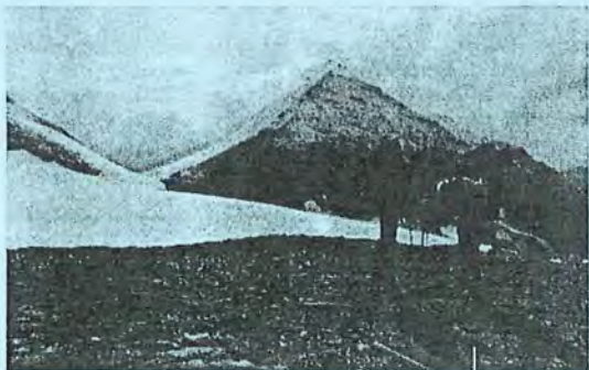
Fuscherkarkopf links im Bild die Nordwand